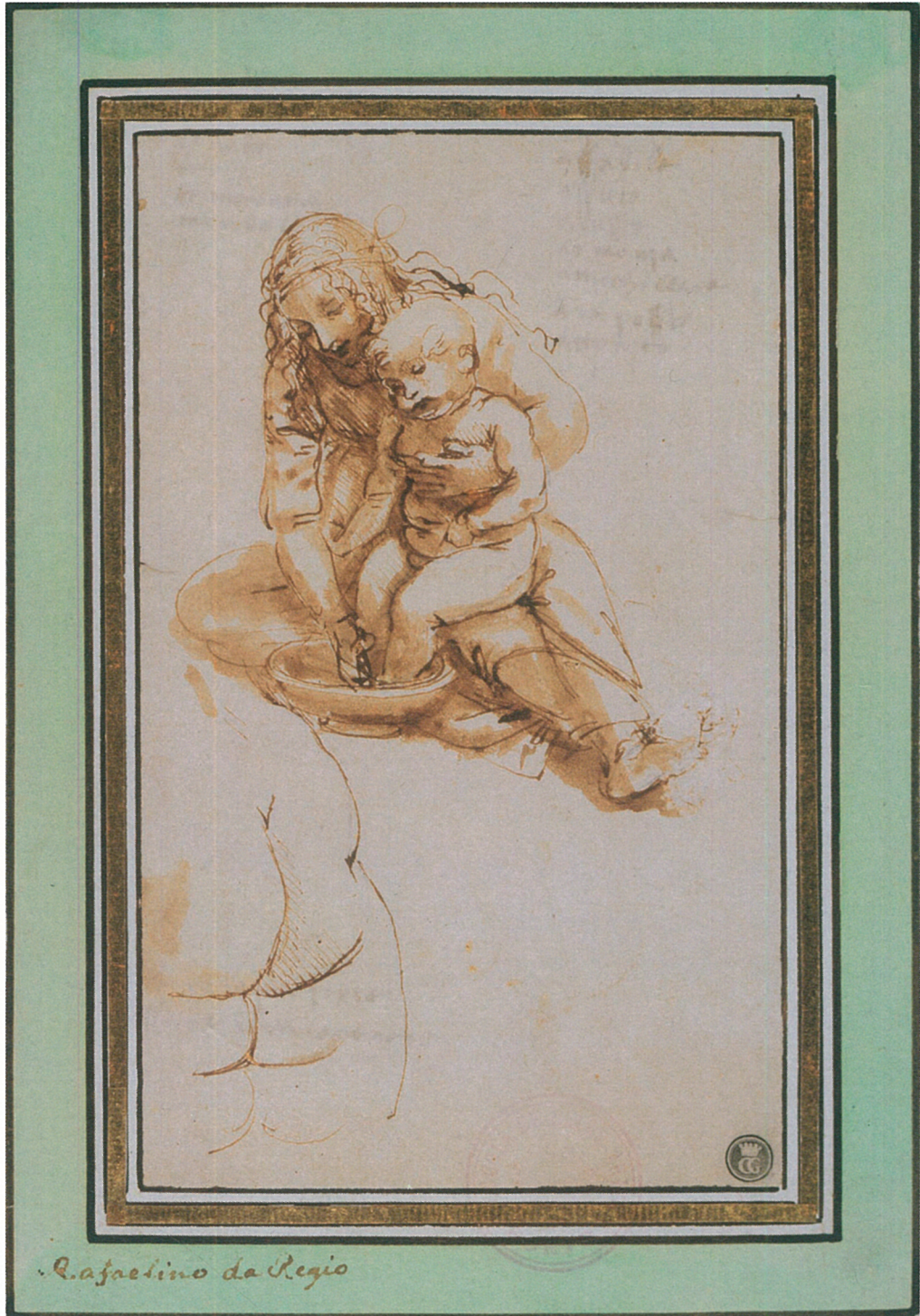
Raffaellino da Reggio